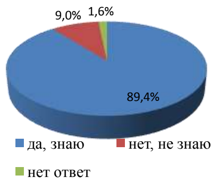
Рисунок 1 - Знания респондентов о разновидностях вирусных гепатитов

Результаты проведенного опроса свидетельствуют о достаточно высоком числе опрошенных, осведомленных о мерах по предупреждению