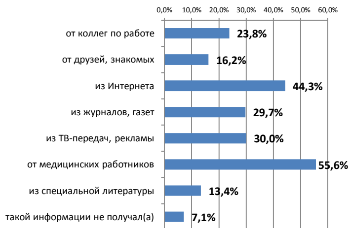
Рисунок 3 – Наиболее предпочитаемые источники информации о вирусном гепатите В.

заболевания вирусным гепатитом В (77,1%). По мнению участников анкетирования к мерам профилактики вирусного гепатита В можно отнести следующее: использование индивидуальных предметов личной гигиены